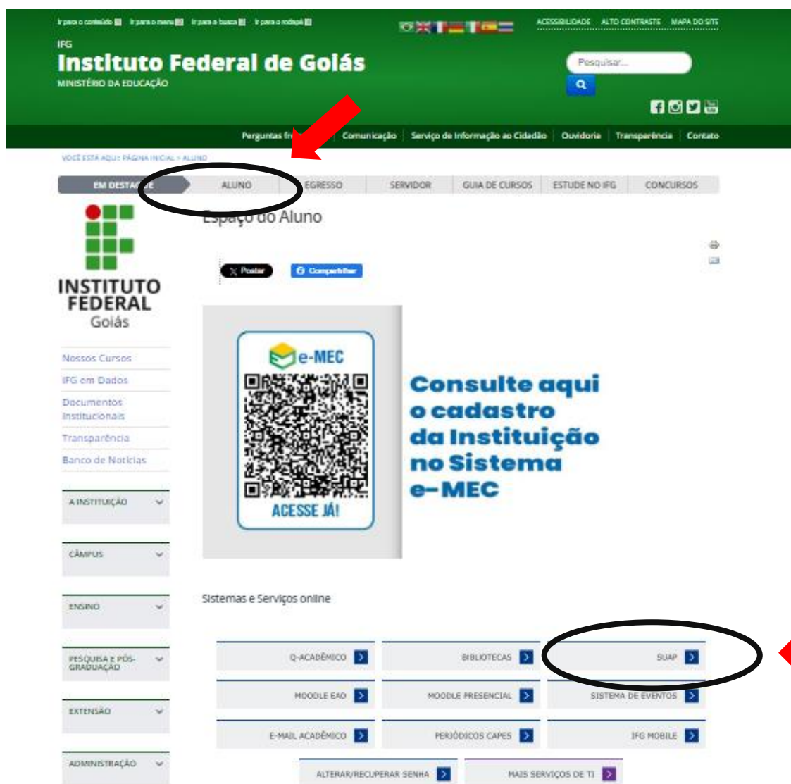
Figura 2 – Site IFG /Aluno/Página de acesso SUAP